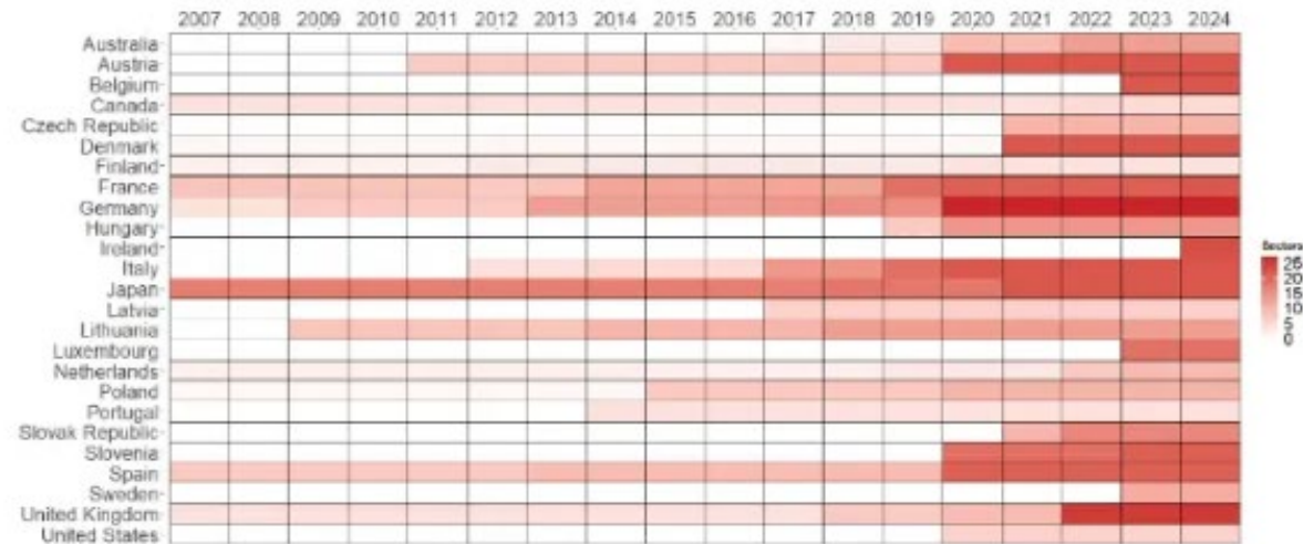
Figure 2: Expanding number of sectors screened over time