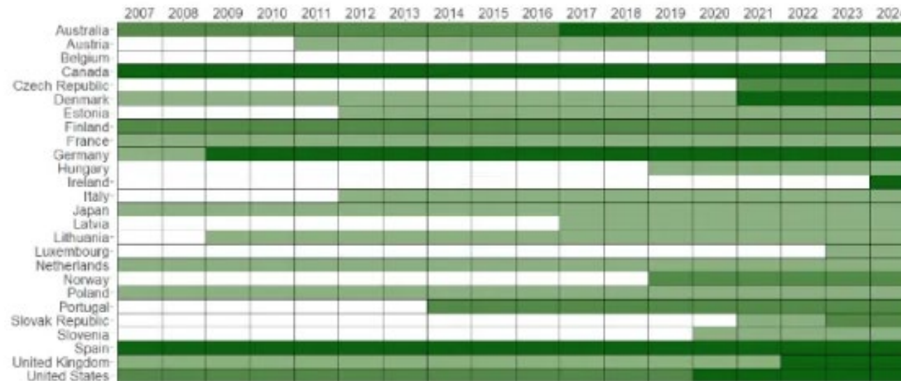
Figure 1: The rise of investment screening mechanisms in advanced economies